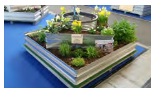
Mit Wasserbehälter eckig