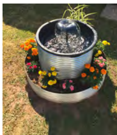
Mit Wasserbehälter rund